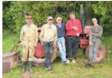
Insgesamt 47 Mitarbeiter bewirtschaften unter fachkundiger Anleitung das Hofgut Rock- linghausen.

Das Hofgut Rocklinghausen ist Arbeitsstätte und Wohnrichtung zugleich. 47 betreute Mitarbeiter, die auch auf dem Hofgut leben, bewirtschaften unter fachkundiger Anleitung den Bauernhof mit seinen Ländereien. Seit 1983 wird das Hofgut vom Lebenshilfe-Werk Kreis Waldeck-Frankenberg e. V. zur beruflichen und sozialen Rehabilitation seiner Bewohner unterhalten. 1990 wurde der 86 Hektar große Betrieb auf ökologischen Landbau nach den Richtlinien von Bioland umgestellt. Eine schwarzbunte Milchviehherde mit 28 Kühen ist der Kern des Be-