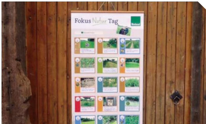
Abb. 1: Die Dokumentation der Beratung verbleibt direkt vor Ort