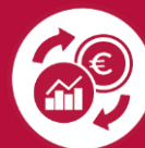
Abb. 3, © Eigene Abbildung

Die ausführlichen Ergebnisse des Projekts 11NA092 finden Sie unter: www.orgprints.org/29627/