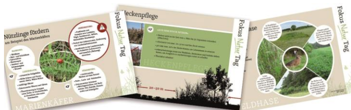
Abb. 3: Infokarten – Beispiele: Nützlinge, Heckenpflege und Feldhasen

Der Fokus-Naturtag stellt eine erprobte Methode für die erfolgreiche Beratung von landwirtschaftlichen Betrieben dar. In mehreren Bundesländern wird eine Biodiversitäts- oder Naturschutzberatung finanziell gefördert. So kann die im Projekt entwickelte Methodik vermehrt in der praxisnahen Beratung zum Einsatz kommen.