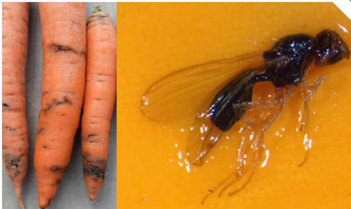
Abb. 1: Fraßschäden der Möhrenfliegenlarven (li), Möhrenfliege (re)