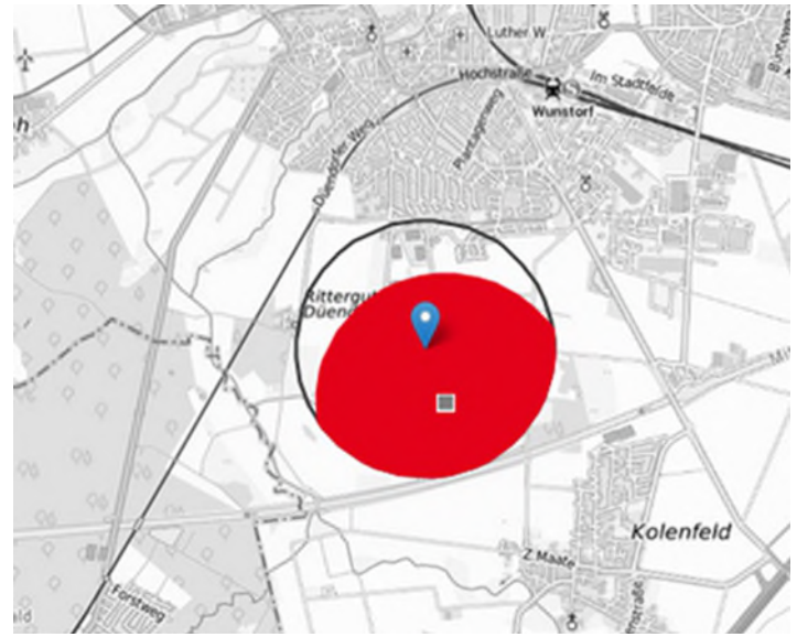
Abb.3: Risikobereich (rot) für die geplante Anbaufläche (Karte: ©BKG 2025).

Die Larven der Möhrenfliege können starke Schäden an Möhren verursachen und die Qualität und Vermarktbarkeit der Möhre beeinträchtigen. Ein Entscheidungshilfesystem zur Aktivität der Möhrenfliege sowie zur Planung von Anbau, Ernte und Kulturschutzmaßnahmen ist daher essenziell. Die Entwicklung der Möhrenfliege vom Ei zur ausgewachsenen Fliege ist temperaturabhängig. Diese Eigenschaft kann für Prognosemodelle genutzt werden, um mithilfe von Wetterdaten die zeitliche Aktivität der Möhrenfliege zu prognostizieren. Möhrenfliegen treten in zwei, teilweise auch in drei Generationen pro Jahr auf. Die zweite Generation verursacht den größten Schaden (Abb. 1).