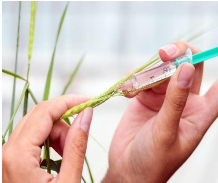
Abb. 3: Künstliche Infektion einer Gerstenähre

Mit dem Anstieg der ökologisch bewirtschafteten Flächen nehmen samenbürtige Krankheiten, v. a. der Flugbrand, wieder an Bedeutung zu, da die chemische Beizung im ökologischen Landbau nicht möglich ist. Vor allem in der Erzeugung von ökologischem, qualitativ hochwertigem Saatgut stellt der Flugbrand eine Herausforderung dar, weil der Vermehrungsbestand bei mehr als drei Brandähren auf 150 m 2 aberkannt wird. Zusätzlich wird ökologische Braugerste nicht in ausreichenden Mengen in Deutschland produziert und Mälzereien sind deshalb gezwungen den Rohstoff aus anderen Ländern zu importieren. Daher ist eine Ausweitung des ökologischen Sommergerste-Anbaus in Deutschlands notwendig, um die gestiegene Nachfrage zu decken.