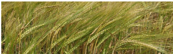
Abb. 4: Gerste im Feld

Es wird deutlich, dass besser angepasste Sorten bereitgestellt werden müssen, um den verschiedenen Anforderungen gerecht zu werden. Im Projekt wurde auch die Ausbreitung des Pilzes in der Pflanze untersucht und an der Entwicklung neuer molekularer Marker gearbeitet, um eine gezielte und schnelle Selektion auf resistente Pflanzen zu ermöglichen.