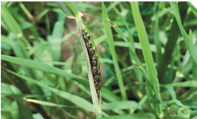
Abb. 1: Flugbrandähre