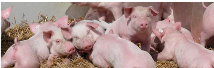
Abb. 4: Unkupierte Schweine in ökologischer Haltung

Die Erblichkeitsschätzwerte für Schwanzverletzungsmerkmale und Schwanzbeißen variierten je nach Merkmal und Entwicklungsstadium von 0 bis 0,22. Die Möglichkeit einer indirekten Selektion auf Basis der Handhabung unter Stress wurde untersucht. Die geschätzten Erblichkeiten für Handhabungsverhalten lagen zwischen 0,19 und 0,28. Die genetischen Korrelationen mit Leistungsmerkmalen waren niedrig. Die Schätzwerte der genetischen Zusammenhänge zwischen dem Handhabungsverhalten und dem Schwanzbeißenverhalten waren wenig konsistent. Die Untersuchung zeigte, dass Genotyp-Umwelt-Interaktionen nicht auszuschließen sind.