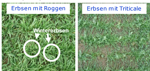
Abb. 3: Gemengebestände in DAR, Ende November 2011

Vorteilhaft für den Erbsenreinertrag waren Gemengepartner, die eine geringe Konkurrenzwirkung aufwiesen. Auf dem Standort DFH entwickelte sich die Triticale sehr üppig und war konkurrierender als Raps und Rübsen. Dagegen entwickelte sich der Roggen auf dem Standort DAR schon in der Vorwinterentwicklung üppiger als die Triticale (Abb. 3).